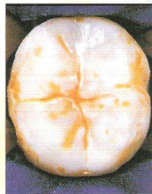
Superficie del dente prima della sigillatura.