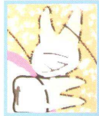
Dente del giudizio incluso.