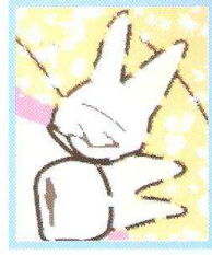
Dente del giudizio parzialmente erotto.