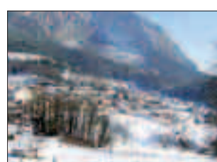
Una veduta di Ivano Fracena